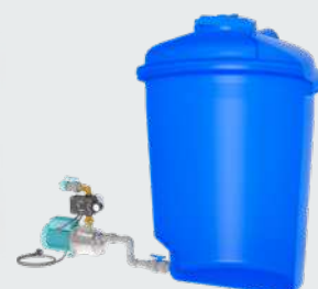
Montage hors de la citerne