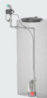
Montage dans la citerne